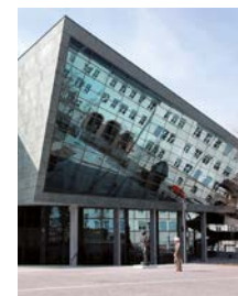
Darmstadtium Am Schlossgraben