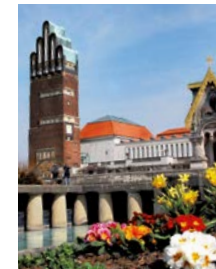
Institut Mathildenhöhe Olbrichweg