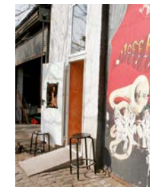
Hoffart Theater Lauteschlägerstraße