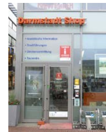
Darmstadt Shop Luisenplatz