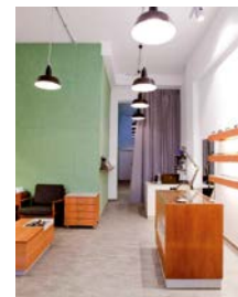
Klar Augenoptik Schulstraße