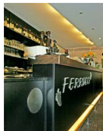
Ferucci, Restaurant Johannesplatz