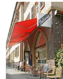
Café Bellevue Eckhardtstraße