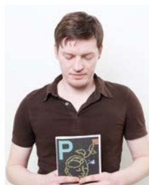
Fitz 35, Schauspieler