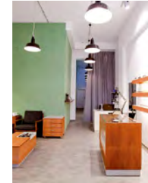
Klar Augenoptik Schulstraße