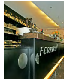
Ferucci, Restaurant Johannesplatz