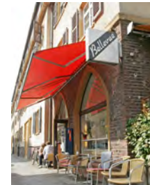
Café Bellevue Eckhardtstraße