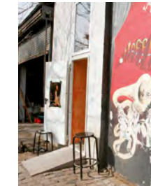
Hoffart Theater Lauteschlägerstraße