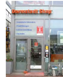
Darmstadt Shop Luisenplatz