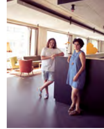
806qm + 221qm Café & Bar Alexanderstraße 2