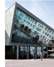
Darmstadttium Am Schlossgraben